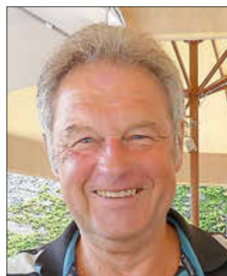
Werner Michaltzik Foto: Bildquelle: vhs Regionalverband Saarbrücken

Wilhelm Busch – Zeichner, Dichter, Schriftsteller, Maler? – Eine Spurensuche Kurs 9814