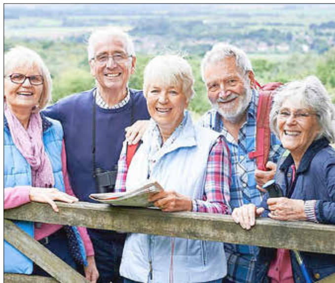
Freude am gemeinsamen Lernen und Erleben mit der vhs Regionalverband Saarbrücken

Auch in diesem Semester bietet die vhs Regionalverband Saarbrücken wieder ein abwechslungsreiches und spannendes Programm für alle ab 65 Jahren. Ob Vorträge, Kurse, Exkursionen - rund 80 Angebote aus den Bereichen Kunst, Kultur, Sprachen, Bewegung, Entspannung, EDV etc. sorgen für eine vielfältige Auswahl. Zusätzlich zu den bewährten und vertrauten Kursen gibt es auch in diesem Semester einige Kooperationsveranstaltungen mit EUROPAge Saar-Lor-Lux. Interessant und spannend zugleich wird es beispiels-