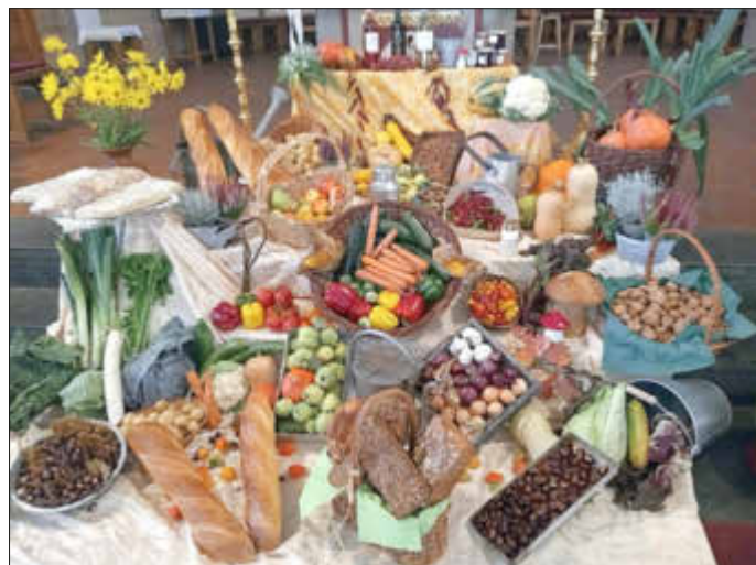
Erntedank 2023 in Fischbach

Am 8. Oktober gestalteten wir, größtenteils mit der Ernte und Blumen aus unseren Gärten, den Erntedank-Altar.