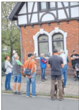
Grubenhaus Quierschiederstraße