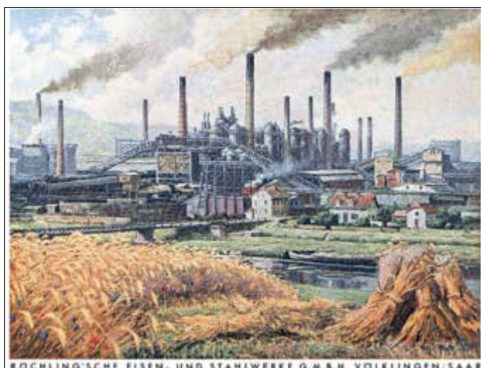
Gemälde der RESW Hochofenanlage 1930

Die vhs Regionalverband Saarbrücken und die Peter Imandt Gesellschaft/Rosa Luxemburg Stiftung Saarland setzen ihre Vortragsreihe „Das Saarland als Montanland – Arbeitskämpfe und soziale Entwicklungen“ mit Hubert Kesternich zu industrie- und sozialpolitischen Themen fort. Die Reihe startet am 11.10.2023 mit „150 Jahre Völk-