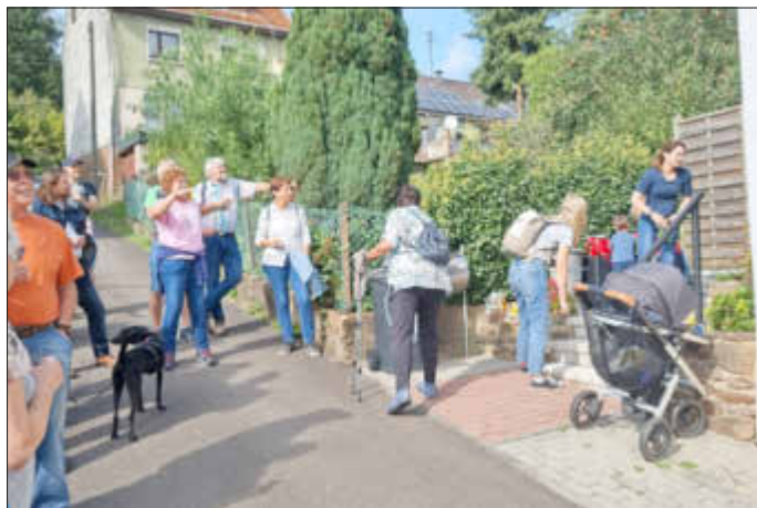
Ehemaliges Arbeiterhaus in der Mittelstraße (im Gässje)