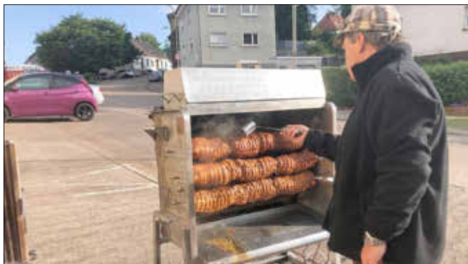
Sommerfest – Kommt vorbei !!!!