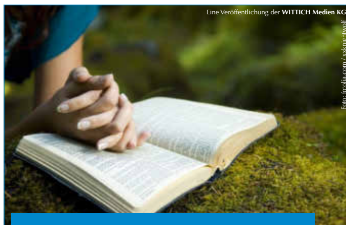
Eine Veröffentlichung der WITTICH Medien KG

Lokal informiert. Druck. Internet. Mobil.