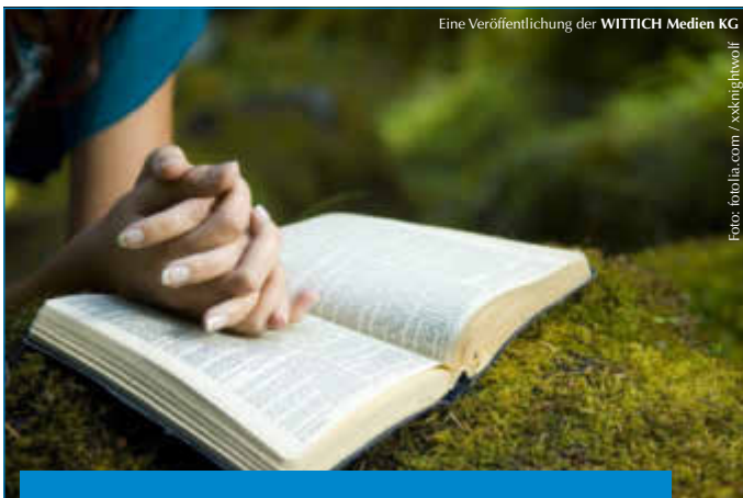
Eine Veröffentlichung der WITTICH Medien KG

LINUS WITTICH Lokal informiert. Druck. Internet. Mobil.