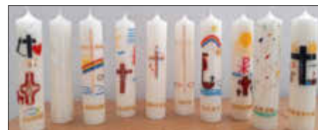
Bild der selbstgestalteten Konfirmationskerzen.