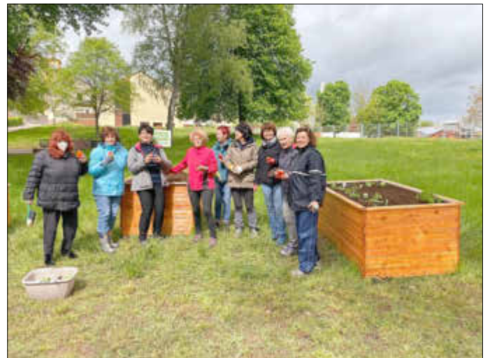
Essbares Dorfzentrum Quierschied