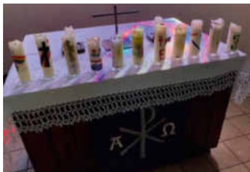
Kerzen der Konfirmandinnen und Konfirmanden auf dem Altar der Ev. Kirche Fischbach