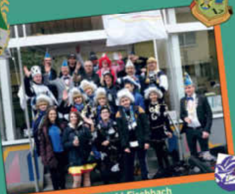
Theaterverein Saargold Fischbach

Zur Orientierung gebbts aach e anstännichie