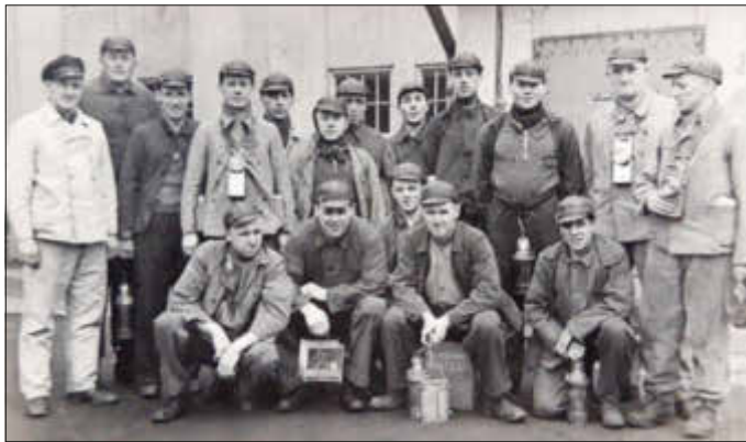
Grubenwehr Fischbach um 1940