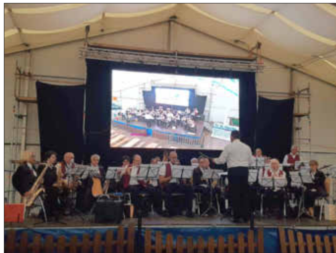
Der Musikverein im Zelt in St. Wendel

alle Funkfreunde zur Jubiläumsveranstaltung „50 Jahre Saarlux-Freundschaftstreffen“ ganz herzlich in die „Alte Näherei“ eingeladen wurde, musikalisch umrahmt. Für die Gäste wurde es ein sehr kurzweiliger Abend mit flotter Musik. Am Sonntag war der Musikverein erstmals eingeladen, am Nachmittag an der Wendelkirche in St. Wendel im Zelt die zahlreichen Besucher zu unterhalten. Nicht nur den Musikrinnen und Musikern hat der Auftritt Freude bereitet, sondern auch den vielen Zuhörern, die sich im Zelt eingefunden hatten. Da durfte die zünftige Oktoberfestmusik natürlich nicht zu kurz kommen.