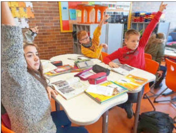
Blick in den Unterricht der jetzigen Klassenstufe 6