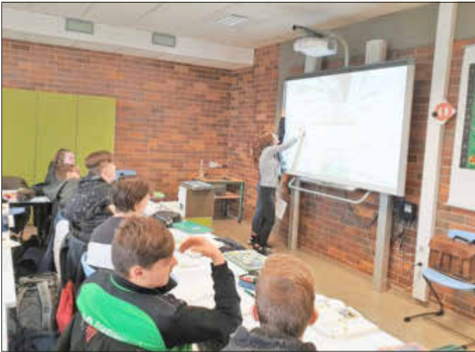
Bis einschließlich Klassenstufe 7 und den Funktionsräumen ist die GemS Quierschied bereits mit modernen Unterrichtsmedien wie SMARTBoards ausgestattet

Auf unserer Webseite: www.gems-quierschied.de finden Sie vorab unter den Menüpunkten „Einblicke“ und „Ganztagschule“ umfangreiche und interessante Informationen von Schulkonzept und der Gestaltung des Ganztags bis hin zu einem Rundgang in 360 Grad. A. Hartmann