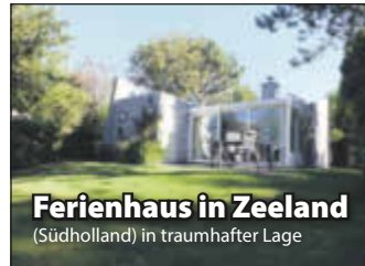
Ferienhaus in Zeeland (Südholland) in traumhafter Lage

Ideal für Familienurlaub mit Kindern, für Hundebesitzer, Taucher & Surfer im attraktiven Landal Park Port Greve.