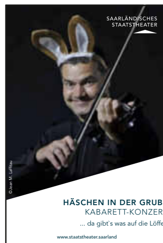
SAARLÄNDISCHES STAATSTHEATER HÄSCHEN IN DER GRUBE KABARETT-KONZERT ... da gibt's was auf die Löffel!