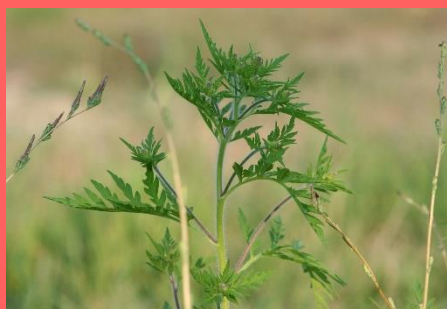
Ambrosia (Beifuß blättriges Traubenkraut)